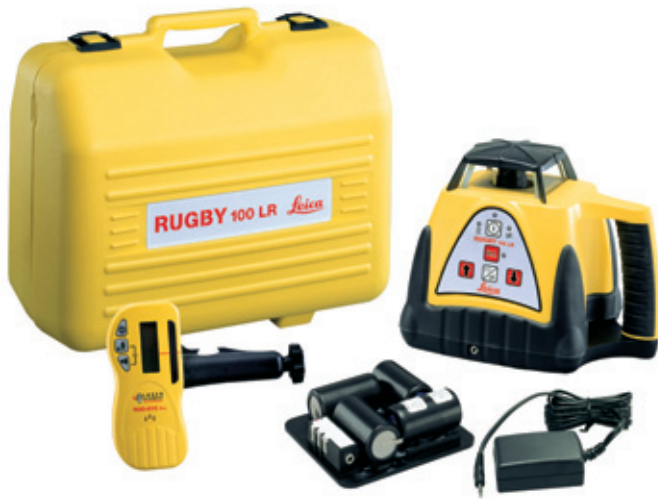
El paquete típico consta de un láser, un maletín de transporte, un sensor ROD-EYE Pro y un pack opcional de baterías de NiMH y cargador